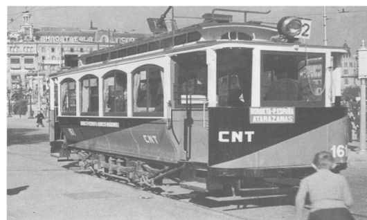
Von der CNT kollektivierte Straßenbahn, Barcelona 1936

Beispiele von Umsonstökonomie sind, dass „der ganze Bahntransport in dem Teil Aragoniens, der in unseren Händen war, d.h. also in Richtung der ost-westlichen Front, kostenlos“ (2, S.250) war. „In allen größeren katalanischen Orten, die mit den kleineren Ortschaften der Umgebung verbunden waren, wurden Polikliniken eingerichtet.“ (2, S.264) „In den neuen Kliniken wurde kostenlos operiert, und die Behandlung in den psychiatrischen Anstalten war ebenfalls kostenlos.“ (2, S. 265) Häufig wurden Material und Dienstleistungen für den Krieg gegen Franco kostenlos geliefert.