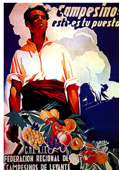
Bauer: Dies ist deine Aufgabe

In Kastilien hatten die Provinz-Föderationen einen bindenderen Charakter als in Aragon. So schufen die Föderationen dort Ausgleichskassen, in die die Dorf-Kollektive Überschüsse solidarisch abliefern sollten, um ärmere Kollektive zu unterstützen. Dieses Prinzip funktionierte ohne Polizeigewalt. In Kastilien kooperierten UGT und CNT (vergl. 7, S. 129 – 131).