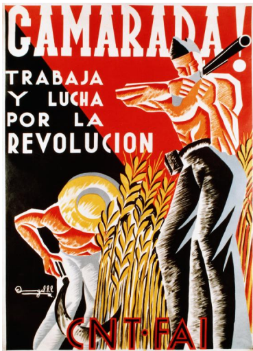
Kamarad! Arbeite und kämpfe für die Revolution