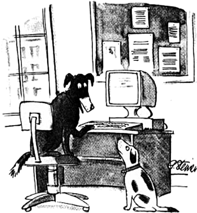
"Na internet, ninguém sabe que você é um cachorro." cartum de Peter Steiner, 1993