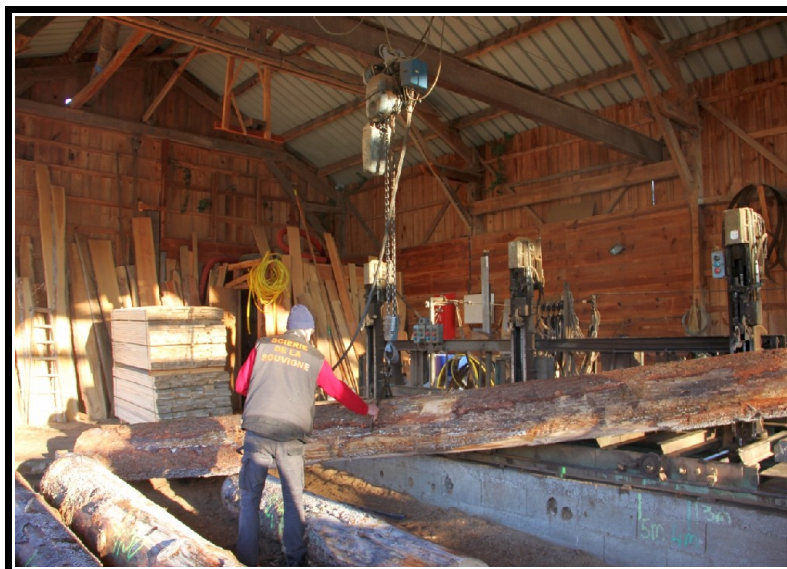
Une petite scierie à Forgès.

Nous pourrions coopérer avec la scierie artisanale de Forgès ! Nous pourrions investir dans un petit engin forestier pour grouper et transporter de petits volumes de bois jusqu'à la scierie. Ainsi, nous pourrions proposer aux propriétaires forestiers une solution pour tirer une ressource de leurs forêts en dehors du circuit industriel, sans passer par la case « coupe rase » !