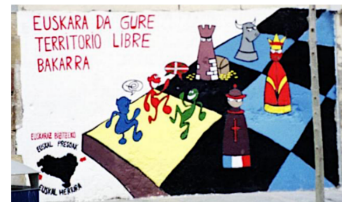
Uma perspectiva anarco-feminista

FORÇA para todxs e para aquelxs que permanecem, COMPANYYES. Isso só começou.