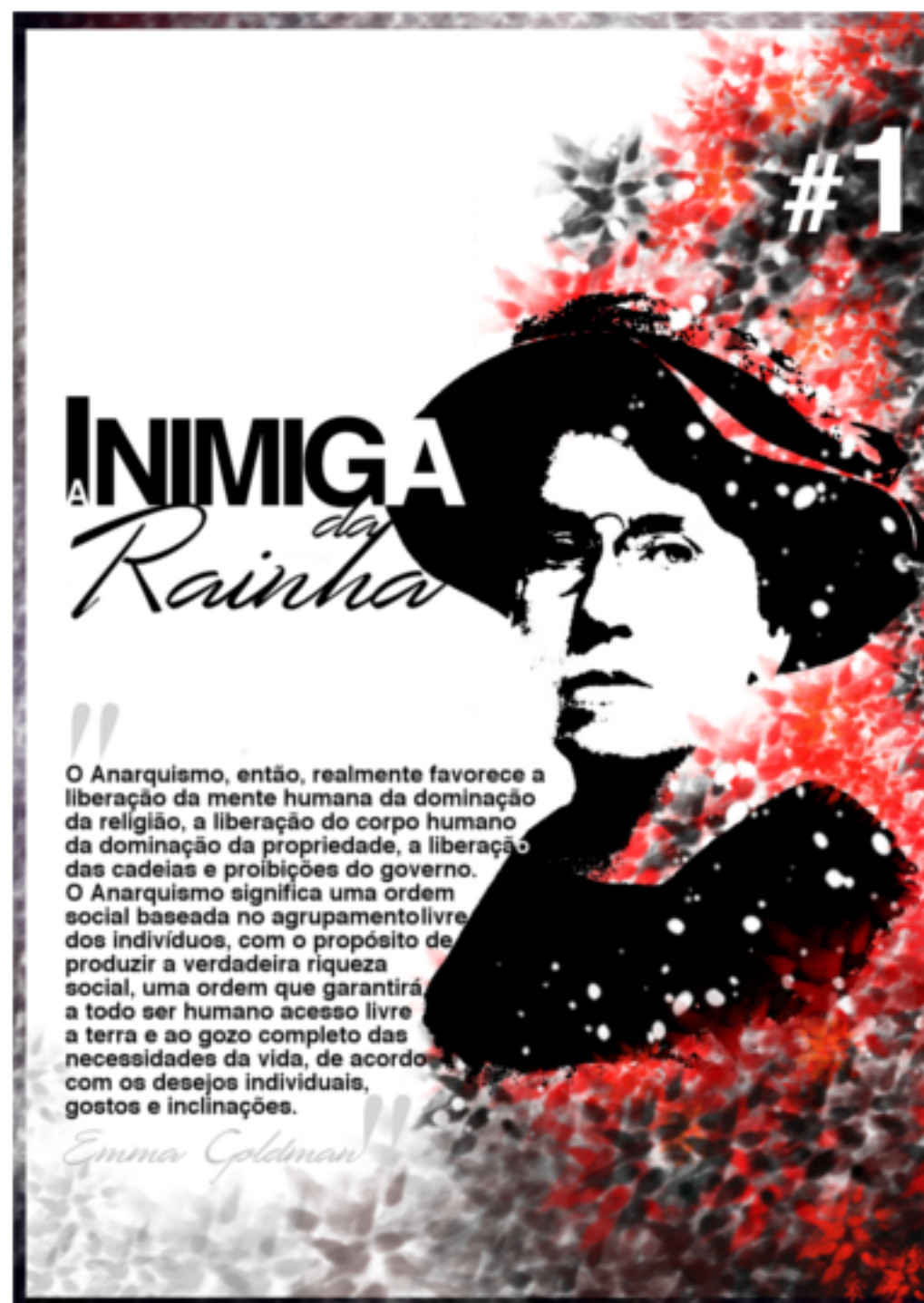
DIY Workshop Capa Alternativa Frases de Emma Goldman

Xs contribuidorxs dessa revista são pessoas de diversas partes do mundo, e certos textos foram traduzidos.