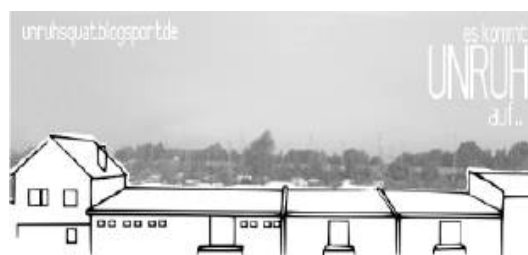
Einer der letzten Versuche in Bremen ein autonomes Zentrum anzueignen, 12.10.2012 0-4#3

Es gibt in den reichen Industriestaaten nicht zu wenig Wohnraum und nicht zu wenige Räume, die geeignet wären, sich zu treffen, um zu kommunizieren, Spaß zu haben, sich zum Selbstermachen, zu DIY zu verabreden etc. Trotzdem haben viele keinen (angemessenen) Wohnraum, werden viele über Zwangsräumungen aus den von ihnen genutzten Häusern vertrieben, weil sie die Miete oder die Hypothekenzinsen nicht rechtzeitig zahlen können. Aber es entwickelt sich auch Widerstand, um solche Zwangsräumungen zu verhindern. Die Eigentümer*innen lassen die Häuser oft lieber leer stehen, oder reißen sie ab, damit der Quadratmeterpreis für Mieten steigt (oder mancherorts zumindest nicht fällt). Angesichts der Warenlogik, ist es schwierig, Orte dauerhaft zu halten, die ohne Geld als Ort für Kommunikation und Auseinandersetzung, für Konzerte, als Selbsthilfwerkstätten offen sind. Wo diese Räume fehlen, wird versucht, sich diese z.B. über Besetzungen anzueignen. 0-4#3