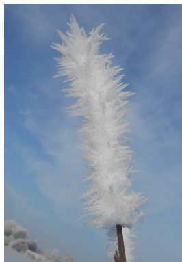
Winterimpression – Eisblume am Strauch 62