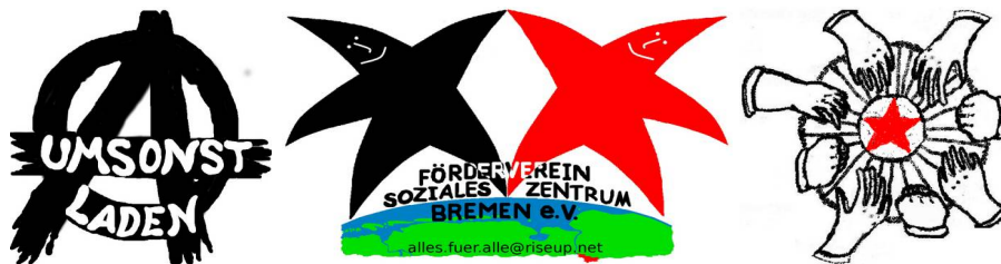
Aktuelles Logo unseres Umsonstladens und des Fördervereins und Logo unserer ehemaligen Nutzer*innengemeinschaft

Das Wissen aus theoretischer Einsicht verändert alleine nichts. Das eine* sich als Anarchist*in versteht, ist einerseits im Fluss und bedeutet andererseits noch lange nicht, dass eine* das auch umsetzen kann. Herrschaftsförmiges Verhalten wurde und wird uns permanent ansozialisiert. Jede* ist in *ihren menschlichen Möglichkeiten durch die herrschenden Verhältnisse mehr oder weniger beschädigt. Das haben wir in teils heftigen, verletzenden Auseinandersetzungen und anschließenden Klärungsprozessen auch in dieser Diskussionsgruppe schmerzhaft erfahren müssen. Die Verbindung aus Praxis und Theorie eröffnet aber die Möglichkeit zu einem Prozess der reflektierten, permanenten Entwicklung. In diesem Prozess verändern wir einerseits uns selbst und versuchen andererseits, in unseren Kämpfen die Welt im Kleinen und Großen zu verändern.