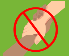
Figure de victime éternelle fuyant les persécutions avec comme seul bagage souffrance et traumatismes, l'assignant à une posture passive

Rapport irrémédiablement paternaliste lourd d'un héritage colonial et d'une charité coupable